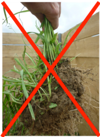
GAIZKI / MAL